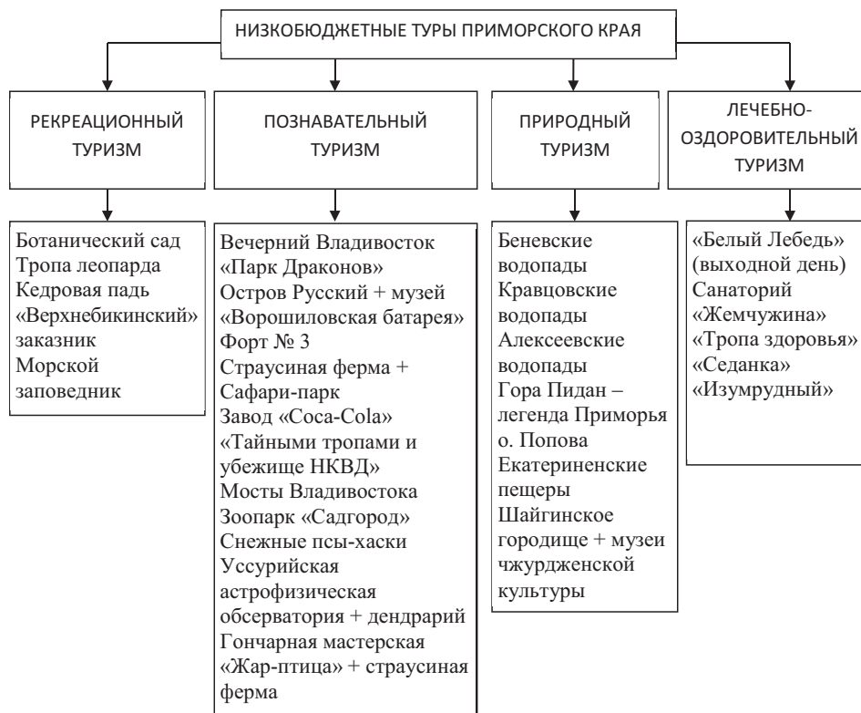
Рис. 2. Низкобюджетные туры Приморского края

Предпочтение по видам отдыха в зависимости от возрастной группы, %