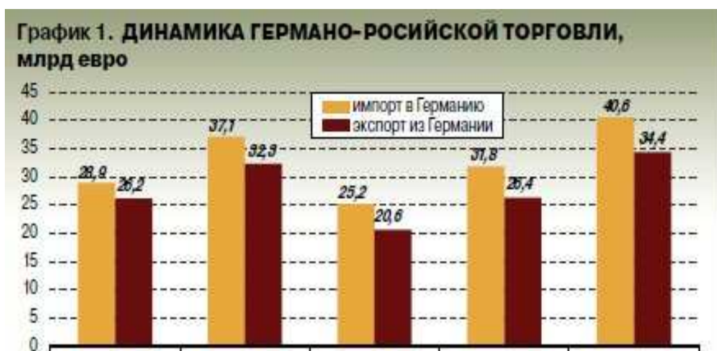
Рис 1. Динамика германо-российской торговли за 2010-2014гг. млрд. евро

Ключевым понятием современных германо-российских отношений является «партнерство». Как отмечал в свое время президент ФРГ Роман Герцог, деловому сотрудничеству этих стран нет альтернативы: ни стремление к доминированию, ни безразличное сосуществование не может быть разумной моделью поведения.