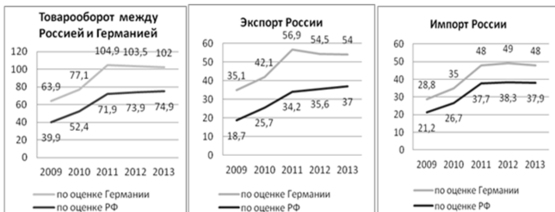
Рис.3. Основные показатели торговли между Россией и Германией (2009-2013)

Оборот услуг в торговле России с Германией в 2013 году составил 12,6 млрд. долл., увеличившись по сравнению с 2012 годом на 11,5%. При этом экспорт услуг оценивался в 4,5 млрд. долл., или на 11,8% больше показателя предыдущего года, а импорт – в 8,1 млрд. долл., или на 12,7% больше уровня предыдущего года.