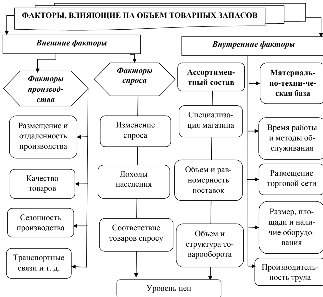
Рисунок 3 - Классификация основных факторов, влияющих на товарные запасы и товарооборот

Классификация основных факторов, влияющих на оборачиваемость и величину товарных запасов, представлена на рисунке 3 в виде схемы.