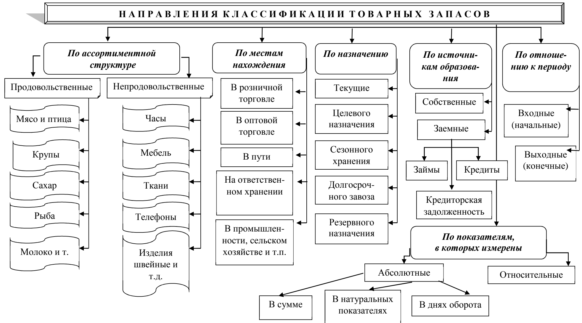
Рисунок 1 – Классификационные группы товарных запасов