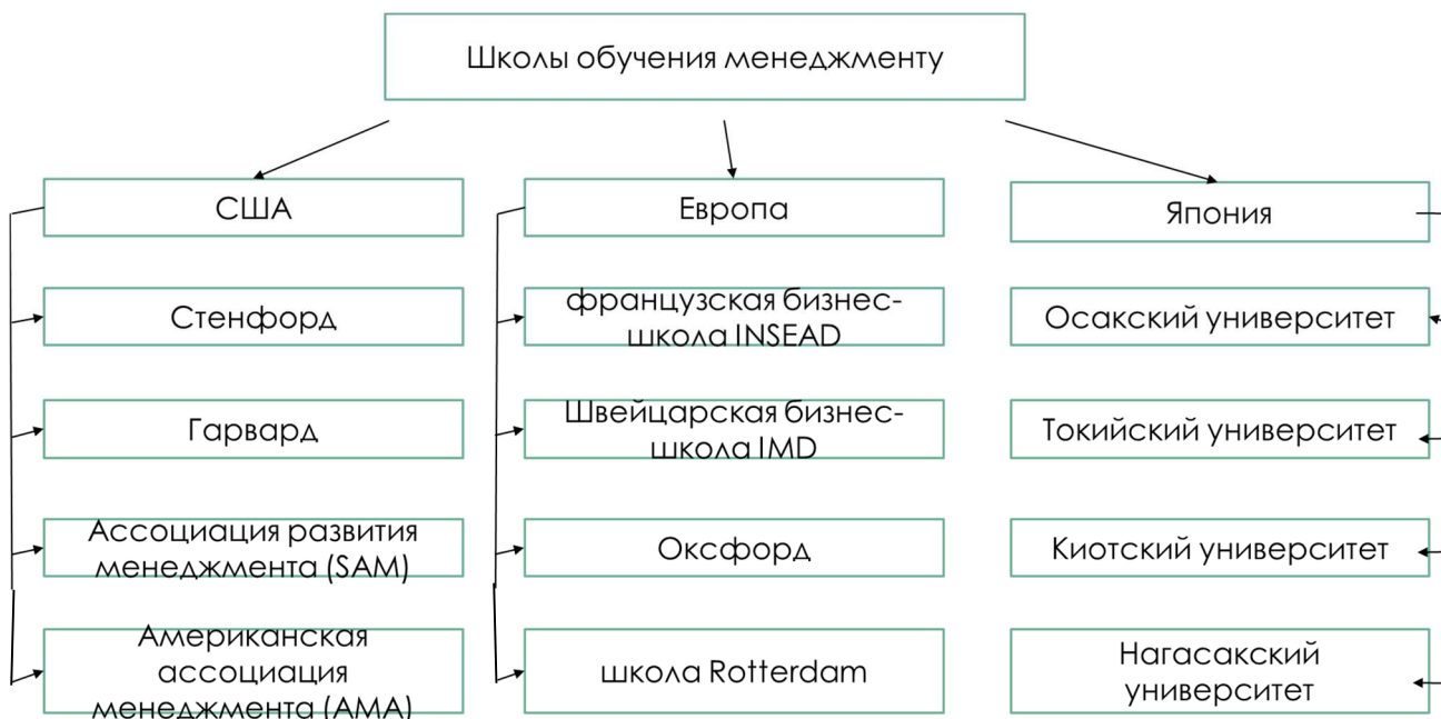
Рисунок 2. Известные школы обучения менеджмента

работоспособность и постоянное самосовершенствование, дисциплинированность и коллективная работа являются профессионально важными качествами менеджера в данной стране. Подготовка менеджеров осуществляется в Осакском, Токийском, Киотском, Нагасакском университетах, где есть различные курсы (рис. 2). Студенты получают конкретную специальность, например, экономическую, но при этом изучают менеджмент [6].