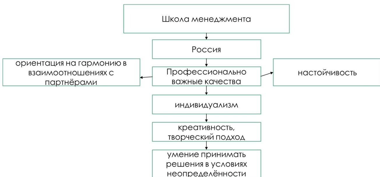
Рисунок 3. Основные профессионально-важные качества при подготовки менеджеров в России