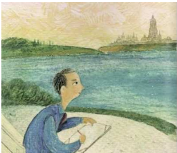
Рисунок 1-"...он мечтал, что когда-нибудь станет художником".