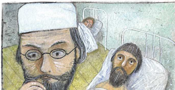
Рисунок 3- Всю свою жизнь посвятил, помогая людям

Владыка всю свою жизнь посветил, помогая больным немощным людям, и после своей смерти люди ежедневно получают помощь от него. Многие современные врачи до сих пор пользуются его методиками, проводятся тысячи сложных операций,