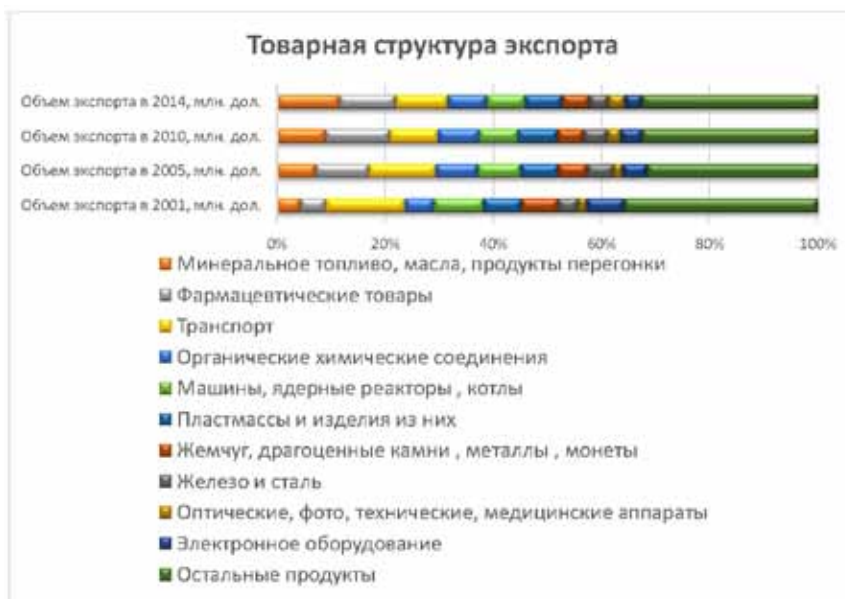
Рис. 3. Товарная структура экспорта Бельгии, 2001, 2005, 2010, 2013 гг., млн. дол.

Основной статьёй импорта Бельгии в 2001 является транспорт (22 420 586 млн. дол. или 12,5% от импорта), на втором месте – машины и оборудование (19 550 920 млн. дол. или 10,9%), на третьем месте – минеральное топливо (15 416 005 млн. дол. или 8,6%). За период с 2001 по 2013 гг. импорт минерального топлива увеличился в 1,38 раз и оказался на первой статье импорта, составив 74 998 412 млн. дол. (16,62% от импорта). На втором месте по импорту – транспорт (44 264 070 млн. дол. или 9,81%, то есть увеличился в 0,2 раз по сравнению с 2001 годом), на третьем – фармацевтические товары (39 413 515 млн. дол. или 5,3%, увеличение в раз по сравнению с 2001 годом (7 411 318 млн. дол.).