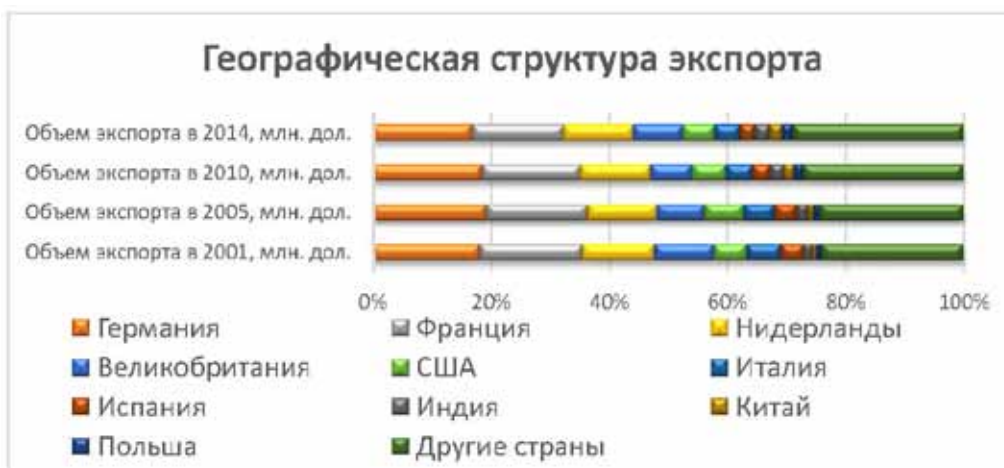
Рис. 1. Географическая структура экспорта Бельгии, 2001, 2005, 2010, 2013 гг., млн. дол.

рует большую часть продукции в Германию (2001 год: 34 503 388 млн. дол. – 18,1%; 2013 год: 78 680 999 млн. дол. – 16,7%), Францию (2001 год: 33 091 491 млн. дол. – 17,4%; 2013 год: 73 189 445 млн. дол. – 15,6%) и Нидерланды (2001 год: 23 189 399 млн. дол. – 12,2%; 2013 год: 55 455 126 млн. дол. – 11,8%) а также в Великобританию, США, Италию, Испанию, Индию, Китай, Польшу. Основными покупателями бельгийской продукции являлись Нидерланды (2001 год: 30 583 811 млн. дол. – 19,3%; 2013 год: 90 496 864 млн. дол. – 17,4%), Германия (2001 год: 29 045 138 млн. дол. – 18,5%; 2013 год: 59 608 165 млн. дол. – 16,2%); Франция (2001 год: 24 062 292 млн. дол. – 12,3%; 2013 год: 46 199 972 млн. дол. – 11,8%). В список основных покупателей бельгийской продукции также входят США, Великобритания, Китай, Ирландия, Италия, Россия, Швеция. Проанализировав географическое распределение экспорта и импорта Бельгии, можно отметить, что основными странами-контрагентами являются страны ЕС. Но все же снижение доли первой тройки за 12 лет говорит об увеличении доли других стран в торговле с Бельгией.