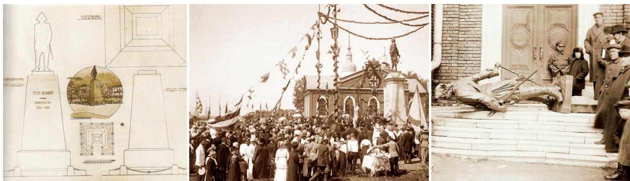
Рисунок 5. Петровский комплекс на набережной Северной Двины: а. – проект постамента для монумента Петра I, арх. С.А. Пец; б. – открытие памятника Петру I, на дальнем плане павильон для Домика Петра I, арх. А.А. Каретников. Фото 27 июня 1914 г.; в. – демонтаж монумента Петра I. 1920-е гг.

валявшаяся рядом с павильоном, и все содержимое Домика Петра I в 1933 году было передано в фонды областного краеведческого музея (АОКМ). В 1948 году монументу императора было определено другое место, куда он и был установлен на родном постаменте. На месте, где ранее стоял памятник императору, установлен в 1950-м году Обелиск жертвам интервенции[5, 2012, № 5, с. 54].