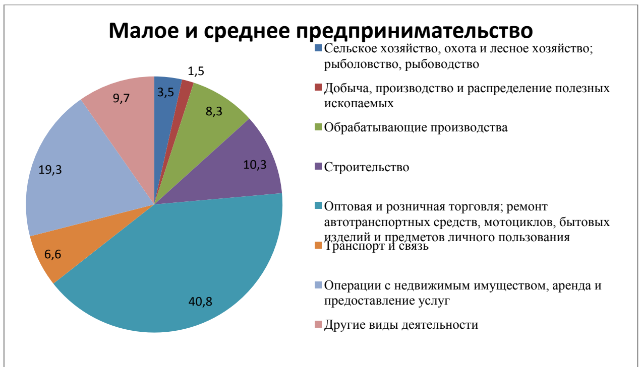
Рисунок 1. Структура малых и средних предприятий по видам экономической деятельности на 01.07.2016 г; % (по данным [3])

Для полного экспресс-анализа данной сферы необходимо рассмотреть также структуру объекта исследования. На данный момент наиболее новыми данными для малых и средних предприятий является статистика 1 полугодия 2015 года, представленная на рисунке 1.