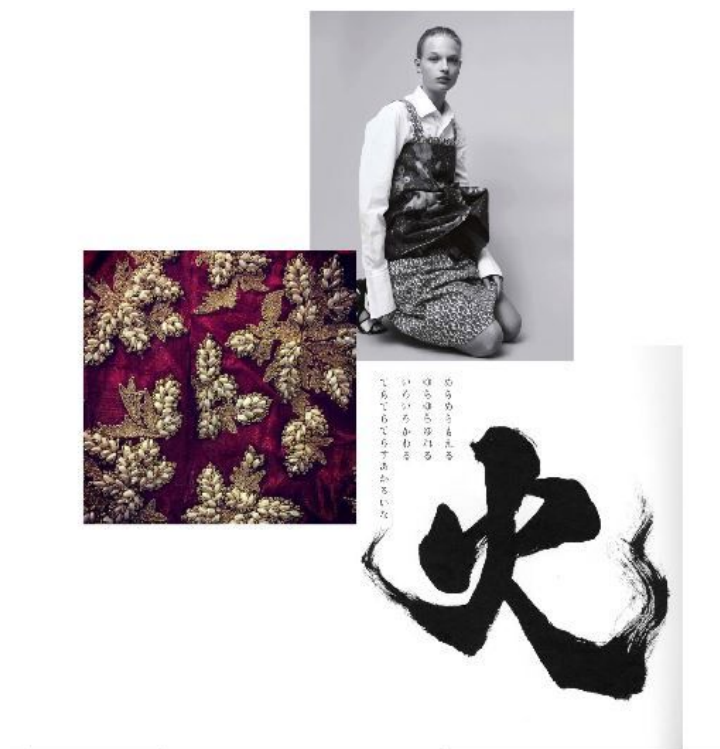
Рис.2 Мудборд к коллекции «Ваби-саби».

двигаться дальше, то именно туда – в сторону усиления симбиотической мысли, связи натурального и синтетического, естественного и искусственного. Объединяя в себе утилитарную, эстетическую и знаковую функции, костюм работает как зеркало эпохи, отражая в яркой, зримой форме социальные, материальные и духовные особенности и достижения[5]. Именно в этом заключается актуальность данной работы. В предпроектном исследовании затронуты аспекты развития современного дизайна. Рассмотрены историческое возникновение эстетики ваби-саби и её заимствование западной культурой. Проведена работа по изучению стилистических особенностей японской эстетики в контексте современного дизайна. В ходе данного исследования была разработана коллекция одежды. Концепция коллекции основана на изучении японской эстетики, выявлении ее основных принципов и адаптации их в коллекции одежды (рис.2). Кроме концептуальной составляющей коллекции, в проектной работе также были учтены требования, продиктованные современной индустрией моды – соответствие сезонным тенденциям, разнообразие ассортимента и актуальное колористическое решение.