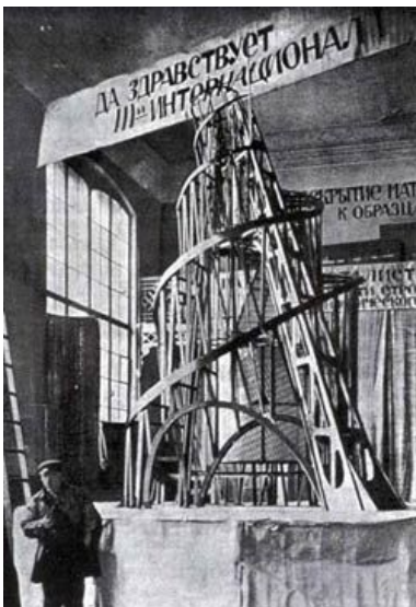
Рис.1. Модель «Башни III интернационала», арх. В.Е. Татлин, 1919 г.

Образцом технического новшества может служить московская радиобашня,