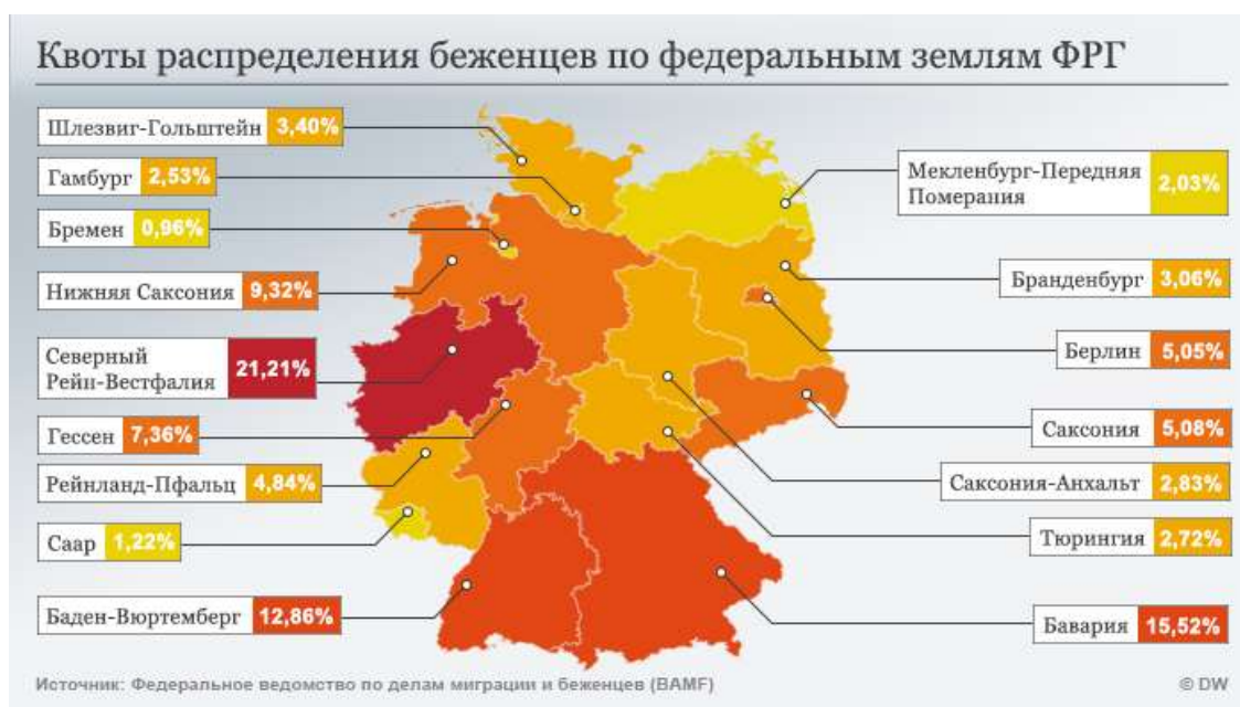
(Рис.3. Квоты распределения беженцев по федеральным землям ФРГ)

Концентрация миграционных потоков, то есть оформление наиболее крупных районов эмиграции по территории Германии представлена на рис. 3 [1].