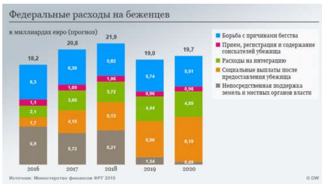
(Рис.4. Федеральные расходы на беженцев )

росту занятости. Одно только ведомство по делам миграции и беженцев BAMF за год удвоило число штатных сотрудников с 3000 до 6000 [4].