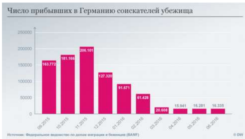
(Рис.2. Число прибывших в Германию соискателей убежища)

мигрантами, либо их потомками. С начала сентября 2015 до конца июля 2016 гг. компьютерная система EASY (Erstverteilung der Asylbegehrenden – первичное распределение желающих получить убежище - нем.) зарегистрировала 900 623 человека (см рис 2) [1].