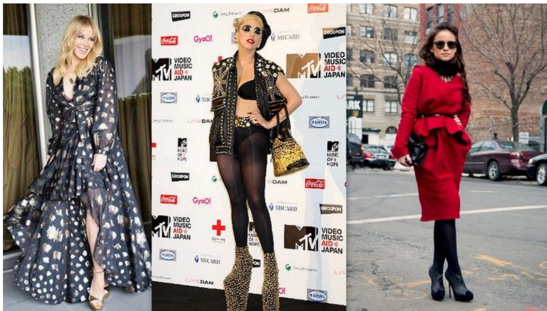
Рисунок 3 – Образы Кайли Миноуг, Леди Гага, Мирославы Дума ( https://uppetite.ru/stil/vdohnovlyayushhie-obrazy/znamenitosti-malenkogo-rosta.html )

стильная. Она предпочитает эклектику и умело сочетает несочетаемое [6]. В её гардеробе не только дорогие марки модных мировых домов, но и весьма бюджетные: Zara, Topshop и H&M (рис. 3).