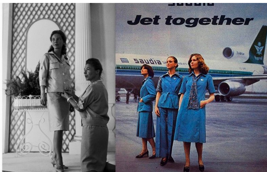
Рисунок 1 – создание одежды в доме Carven ( http://www.izuminki.com/2014/02/03/istoriya-modnogo-doma-carven/ )

который бы занимался конкретно миниатюрными клиентами. Именно поэтому Carven приобрел популярность не только во Франции, ее изделия продавались в США, в Египте, в Бразилии, в Японии. К тому же одежда была по доступным ценам. Количество клиентов возрастало с каждым годом, так как подобные услуги ранее не оказывались. Услугами дома пользовались знаменитые женщины, такие как Эдит Пиаф, Мишель Морган и Лесли Карон, Сесиль Обри и Даниэль Делорм, и многие другие. Слава мадам Карвен жила до девяностых годов. В это время на арене моды появились новаторские идеи и выдающиеся молодые и амбициозные модельеры, но дизайном для миниатюрных так никто не занимался. Однако о творчестве мадам Карвен еще долгое время помнили, ее столетний юбилей прошел красочно и ярко. Были приглашены многие звезды первой величины, проведены показы коллекций [5]. Жизнь мадам Карвен была яркой, она была и осталась узнаваемым модельером. Сама кутюрье отмечала: «Мода сделала меня счастливой, годы, когда я творила, были лучшими в моей жизни!» (рис. 1).