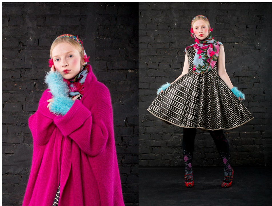
Рисунок 4 – Авторское решение комплекта для миниатюрных девушек

На основе проведенного анализа можно предложить авторский вариант одежды для миниатюрных молодых девушек от 18 до 30 лет. Разработка комплекта ориентирована на девушку ростом 156 сантиметров. Творческим источником послужил образ русской национальной игрушки «Матрешки». Продумывание образа началось именно с силуэтной формы, а точнее преобразование модного овала в трапецию. Комплект состоит из пяти элементов. Он отличается коммерческой направленностью, так как каждый элемент не отличается авангардными решениями и предполагает использование в повседневной жизни. Платье с завышенной талией до колен создает узнаваемую форму матрешки. Используемая ткань – это двусторонняя парча, выкроенная таким образом, что рисунок формирует вертикальные линии. Соответственно, вертикаль позволяет удлинить фигуру невысокой девушки. Пройма платья, низ и горловина обработана трикотажной бейкой, связанной из вискозной золотой пряжи в тон рисунку парчи, с их помощью фиксируются пропорции невысокой девушки (рис. 4).