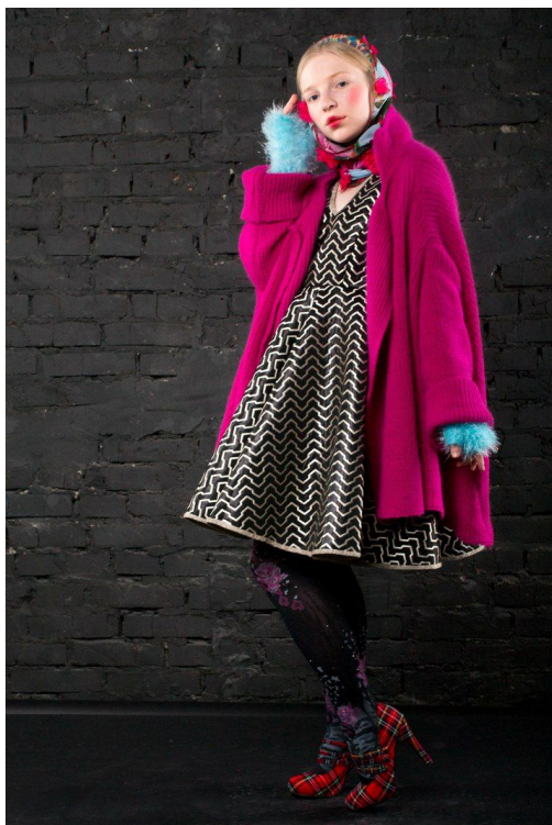
Рисунок 5 – Авторское решение комплекта для миниатюрных девушек

Композиционная целостность комплекта создается за счет сложного, но читаемого ритма линий и живописной гармонии цветовых пятен и акцентов (рис. 5).