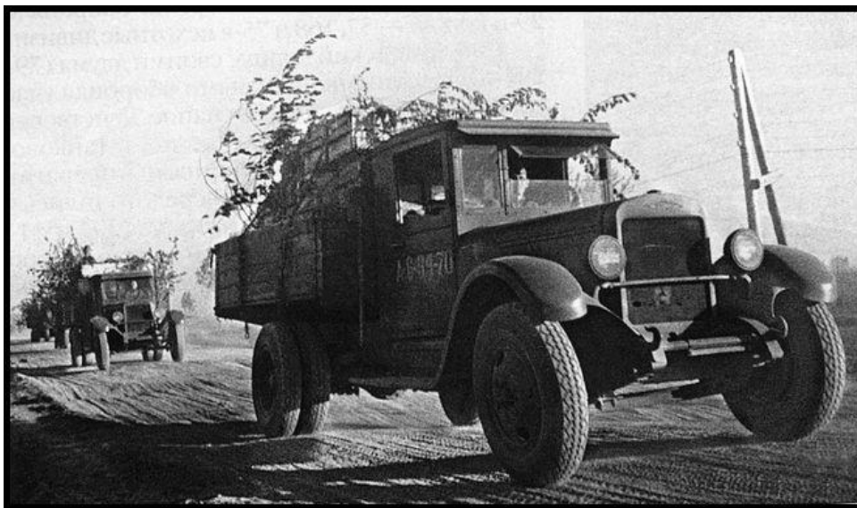
Рис. 2. Боевой автомобиль моего прадедушки

задача любыми путями вывезти секретные документы, женщин и детей в безопасное место. С этим заданием он справился, за что и получил свою первую награду.