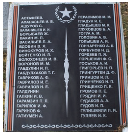
Рис. 4. Братская могила в деревне Старь