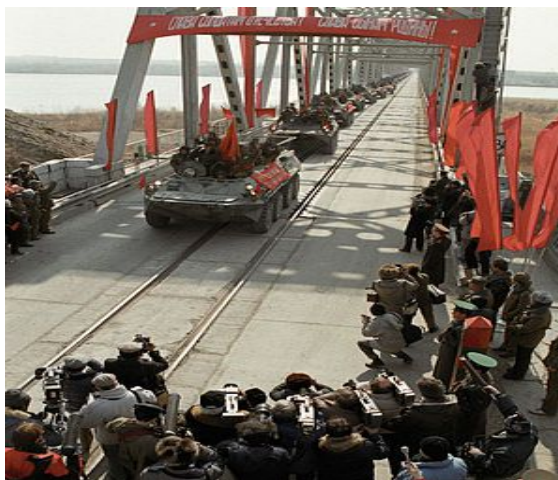
Рис. 8. Вывод советских войск из Афганистана

Кабула. В ноябре-декабре 1988 года обстановка в Афганистане стабилизировалась, но руководство СССР воздержалось от заявления о том, будет ли вывод советских войск до конца или военные действия будут продолжены. В январе 1989 года Афганистан посетил министр иностранных дел Э.А. Шеварднадзе. 15 февраля 1989 года генерал- лейтенант Б.Громов, согласно официальной версии, стал последним советским военнослужащим, переступившим по Мосту Дружбы границу двух сторон.