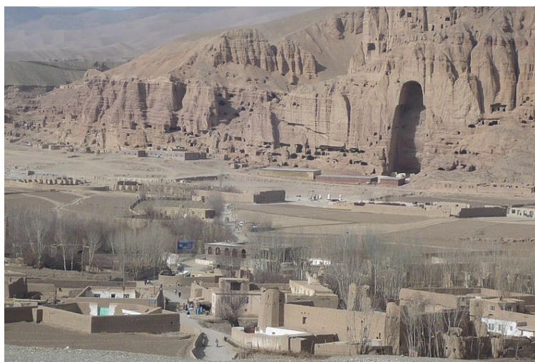
Рис. 5. Вид на скалу, где вырезаны монастыри и Будды в Бамиане

В апреле 1978 года, после Саурской (Апрельской) революции провозглашена Демократическая Республика Афганистан. Главой государства стал Нур Мохаммад Тараки, а председателем Революционного совета — Хафизулла Амин. Правительство стало проводить радикальные реформы, в частности, секуляризацию, что вызывало массовые протесты в традиционном афганском обществе. В стране началась Гражданская война. Нур Мохаммад Тараки, лидер фракции Хальк, был тайно убит членом своей же фракции, который стал главой государства — Хафизулла Амин. В СССР Амина считали ненадёжным человеком, способным в любой момент переориентироваться на Запад.