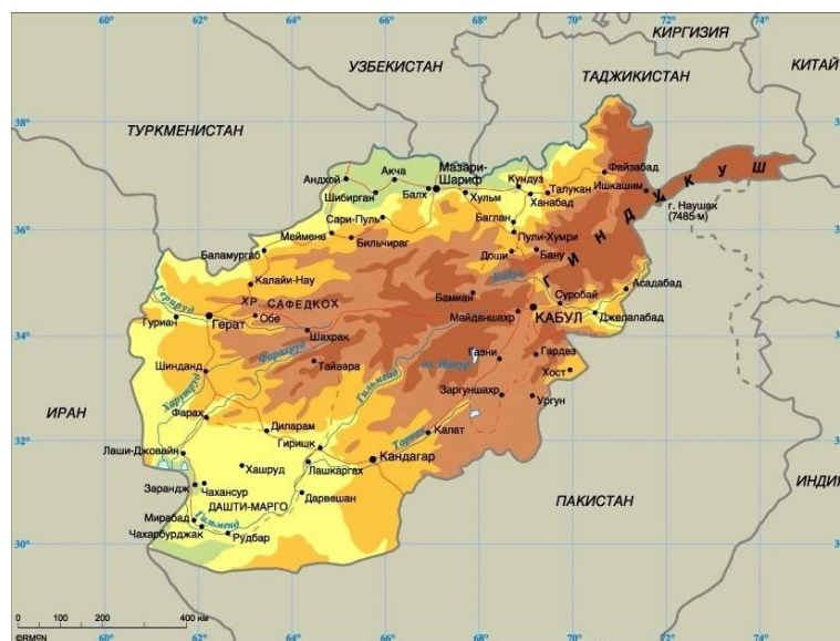
Рис. 2. Карта Афганистана

Доставили автобусом до железнодорожного вокзала г. Рязска и железнодорожным транспортом отбыли в пункт назначения - Республику Узбекистан, в часть города Фергана, воздушно-десантный полк – учебку. После прохождения курса «молодого бойца» по военно-учетной специальности минометчик. По истечении полугода он с группой товарищей - сослуживцев был направлен в демократическую Республику Афганистан. Исламская Республика Афганистан — государство в Центральной Азии, не имеет выхода к морю. Население, по итогам переписи 2015 года, составляет более 32 миллионов человек, территория — 652 864 км 2 . Столица — Кабул. Граничит с Ираном на западе, Пакистаном — на юге и востоке, Туркменистаном, Узбекистаном и Таджикистаном — на севере, Китаем — в самой восточной части страны. Афганистан находится на перепутье между Востоком и Западом и является древним центром торговли и миграции. Он располагается между Южной и Центральной Азией с одной стороны и Ближним Востоком с другой, что позволяет ему играть важную роль в экономических, политических и культурных отношениях между странами региона.