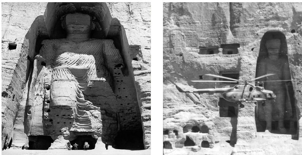
Рис. 4. Бамианские статуи Будды в Афганистане

Местное население проживало в живописной, достопримечательной местности. Особым местом считались Бамианские статуи Будды. Две гигантские статуи Будды (55 и 37 метров), входившие в комплекс буддийских монастырей в Бамианской долине, возраст которых датируется 6 веком нашей эры и относятся к индускому искусству.