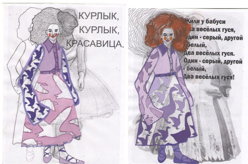
Рис.5. А. Баевская. Графические эскизы к проекту «Летят гуси», 2017

Графический анализ расширит творческие возможности дизайнера. Для такого анализа поэтапно изучают визуальные характеристики источника: форму, структурные элементы, конструкцию, элементы декора, фактуру и цвет (Рис. 5).