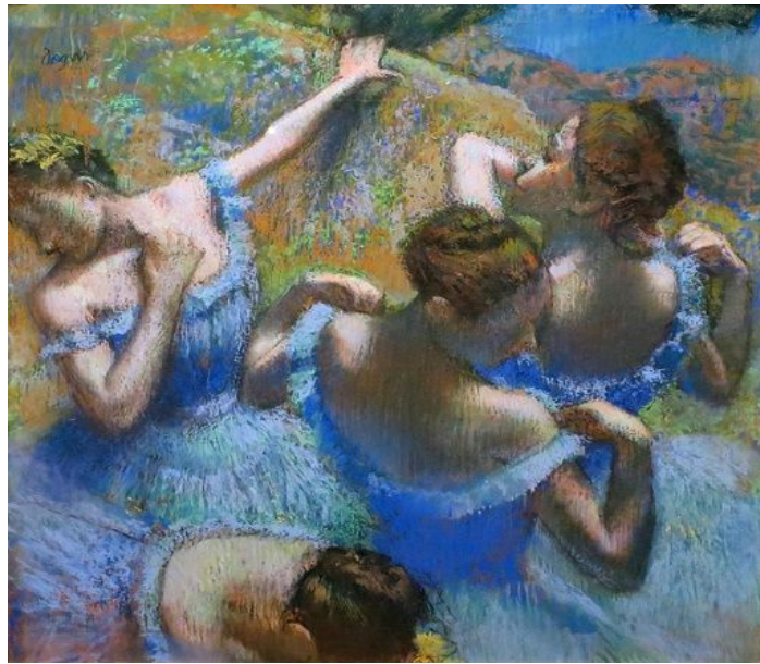
Рис. 1. Э. Дега. Голубые танцовщицы, 1897

все приравнены к академическому идеалу. Каждый зритель наблюдает за грацией и пластичностью балерин, но за этим скрывается всеобъемлющий ежедневный труд (Рис.1).