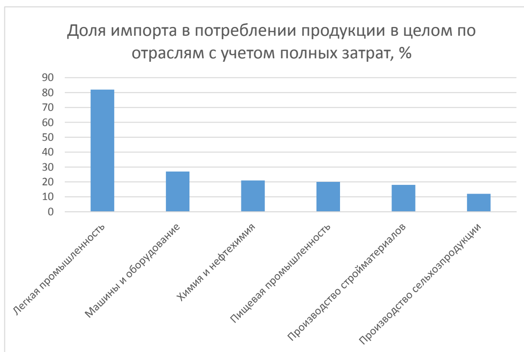
Рисунок 1. Импортозависимые отрасли российской промышленности на 2017 г.

Большинство отраслей российской экономики в большей или меньшей степени являются импортозависимыми, что наглядно проиллюстрировано в следующей диаграмме.