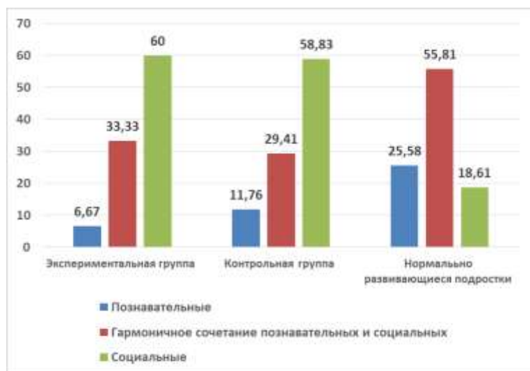
Рис.1. Соотношение мотивов у умственно отсталых и нормально развивающихся подростков

Методика диагностики направленности учебной мотивации (автор Т.Д. Дубовицкая) [6] позволяет выявить направленность и степень выраженности внутренней мотивации учебной деятельности учащихся.