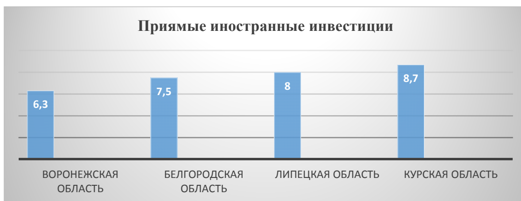
Рисунок 2 – Прямые иностранные инвестиции по регионам ЦФО

Но, проблема заключается в том, что Воронежская область существенно отстает по объему прямых инвестиций, как российских, так и иностранных на фоне других регионов, поэтому необходимо проводить мероприятия по улучшению инвестиционного климата, рисунок 2.