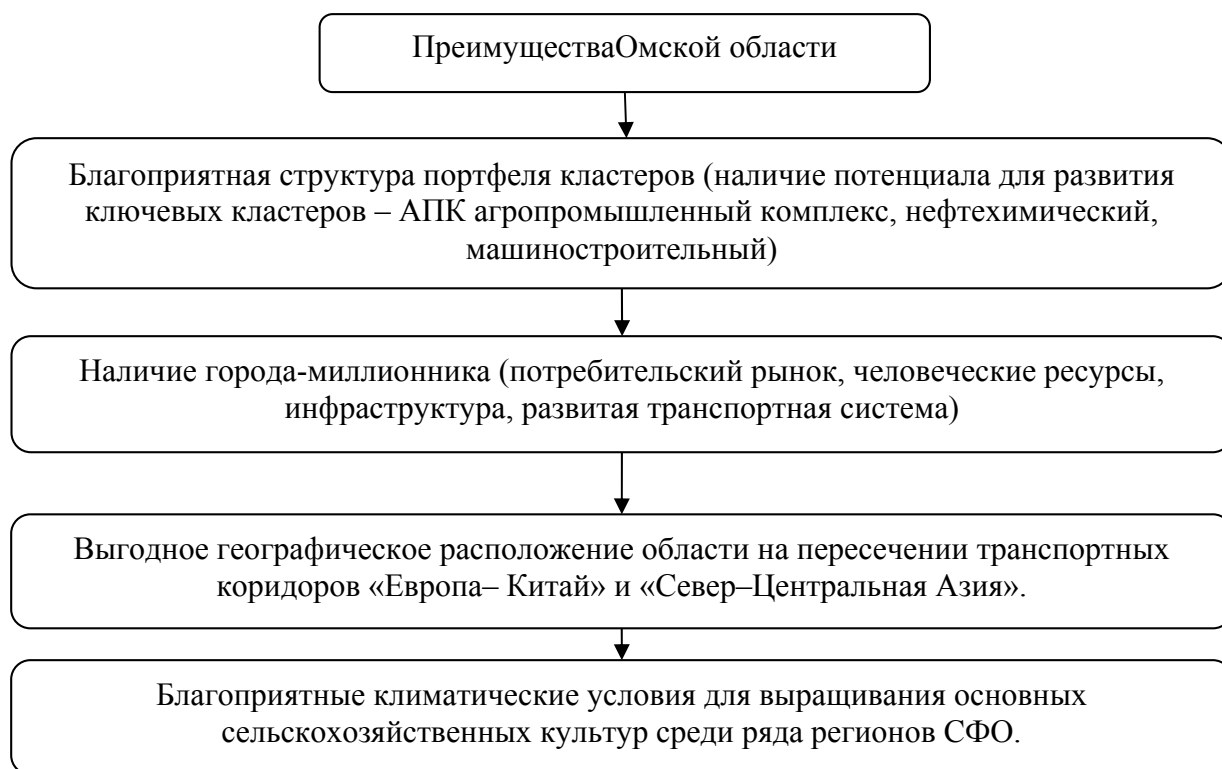
Рисунок 1 – Преимущества Омской области

Омская область позиционируется как регион, привлекательный с точки зрения ведения бизнеса и инвестирования. Несомненными преимуществами Омской области, определяющие ее инвестиционную привлекательность, являются, которые представлены на рисунке 1.