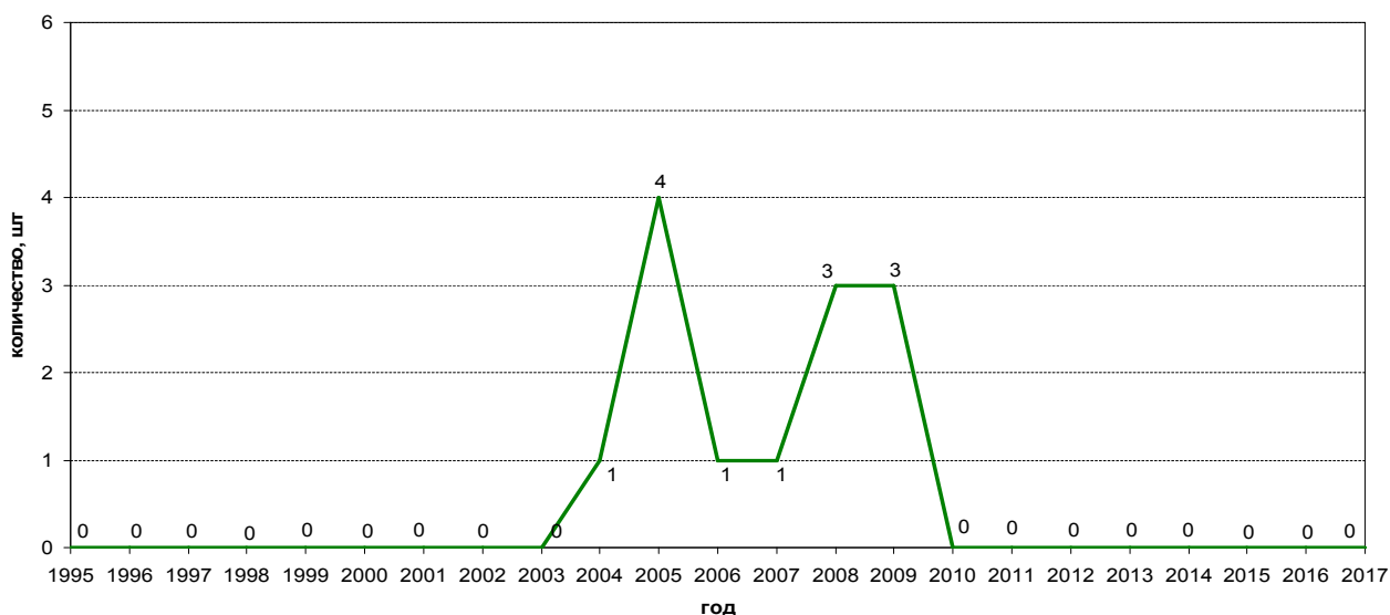
Рис.3 – Временная структура диссертаций, частично посвященных исследованию нарушений пищевого поведения в России в 1995-2017 гг.

На рисунке 3 дано графическое отображение динамики защит диссертаций, частично посвященных исследованию нарушений пищевого поведения.