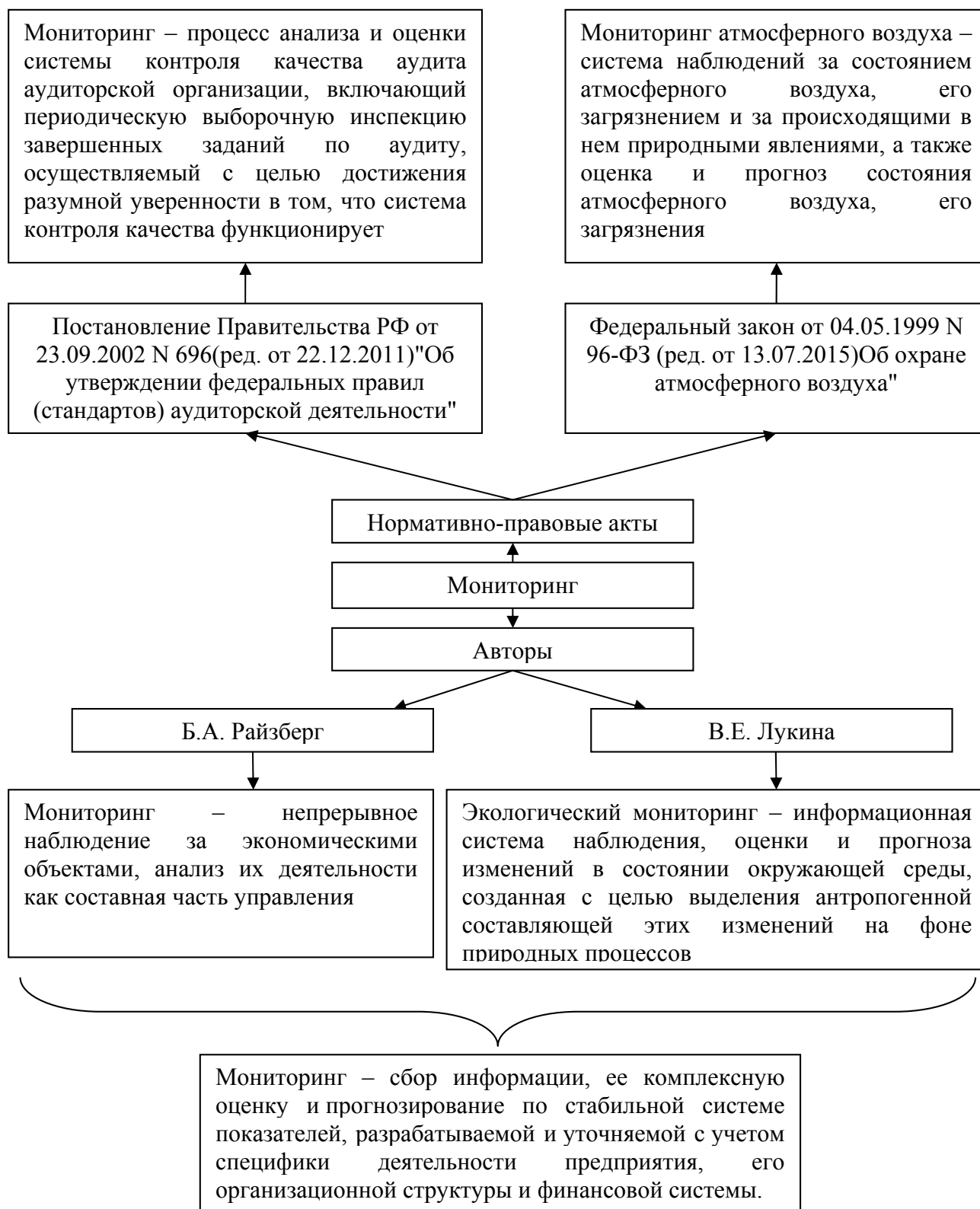
Рисунок 1 – Определения понятия «мониторинг» в различных сферах его применения

В ходе исследования были проанализированы определения понятия «мониторинг» в различных сферах его применения, разработанными авторами и нормативно-правовыми документами, которые представлены на рисунке 1.