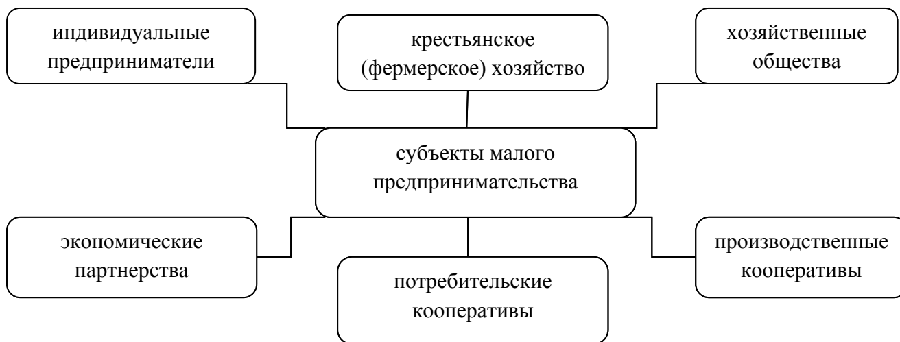
Рис.1 Организационно-правовые формы малого предпринимательства

Согласно ст. 4 Закона «О развитии малого и среднего предпринимательства в Российской Федерации» от 24 июля 2007 г. № 209-ФЗ [2], субъектами малого предпринимательства являются малые предприятия, функционирующие в следующих формах: индивидуальные предприниматели; крестьянское (фермерское) хозяйство; хозяйственные общества; экономические партнерства; потребительские кооперативы; производственные кооперативы (рис.1).