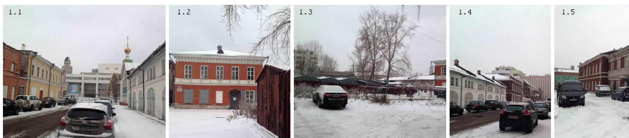
Рис. 1. Визуальное искажение эстетики исторического ландшафта историко-культурной заповедной территории «Старый Архангельск»

Относительно нарушения визуального искажение эстетики исторического ландшафта следует отметить, что построенные в XX и начале XXI веков высотные здания существенно искажают восприятие объектов культурного наследия (рис.1). Торговые центры «Центр», «Гранд-Плаза», отделения Россельхозбанка и банка ВТБ, расположившиеся в бывшем Облрыболовпотребсоюзе, Дом детского творчества и гостиница «Двина» резко диссонирует своими объемами с памятниками истории (рис. 1.1, 1.4). Кроме того, на самой территории «Старый Архангельск» находятся хозяйственные постройки и частные гаражи (рис. 1.2, 1.3). К Николо-Корельскому подворью в советский период были выполнены пристройки, фасады которых контрастируют с историческими сооружениями (рис. 1.5).