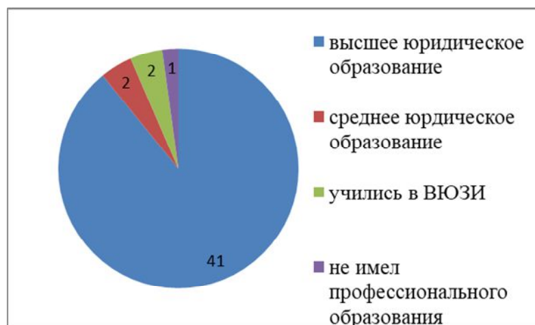
Рис. 1. Показатели уровня образования кадрового состава отдела юстиции Магаданской области (1970-1975 гг.)

В рассматриваемый период штаты отдела юстиции Магаданской области насчитывали 46 чел., из них: 9 оперативных работников и 37 народных судей. Высшее юридическое образование имел 41 чел., среднее юридическое образование – 2, обучались во Всесоюзном юридическом заочном институте (ВЮЗИ) – 2, не имели профессионального образования – 1. (См. Рис. 1). У всех сотрудников был значительный опыт работы в органах суда и прокуратуры [1, Д. 35. Л. 20].