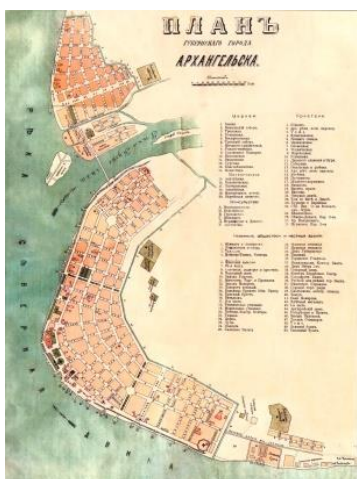
Рис. №1. План города 1890 г. АОКМ.

управления, интеграция развития хозяйственного, экономического и культурно-исторического потенциала территории, общей численностью 683,5 тыс. человек. Первые предложения о совместной деятельности муниципалитетов поступили из департамента экономического развития администрации города Архангельска. Они касались «развития арктического туризма, межмуниципального транспортного сообщения, решения проблем обращения с твердыми бытовыми отходами, внедрения единой социальной карты, совместного использования рекреационных объектов и информационных ресурсов» [1].