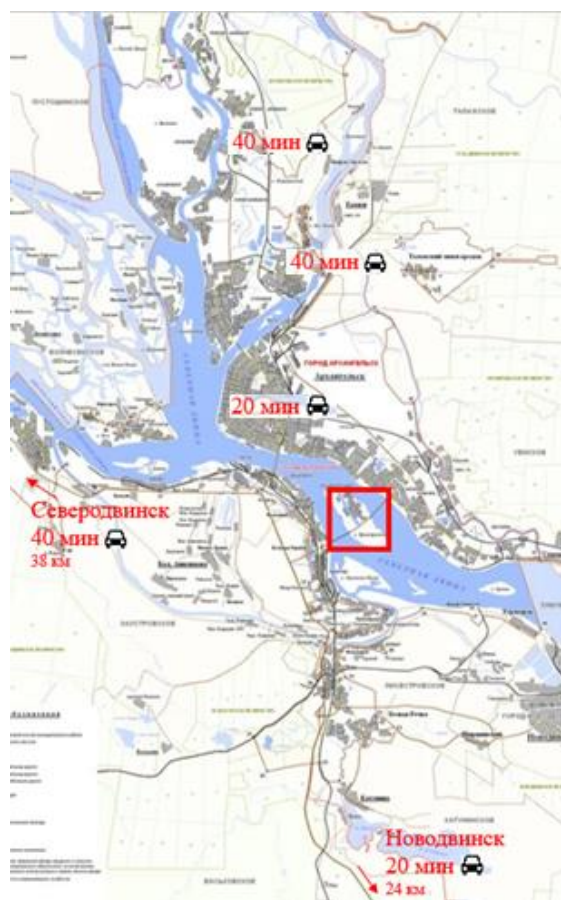
Рис 6. Транспортная доступность острова Краснофлотский из населенных пунктов агломерации «Большой Архангельск»

Тем самым делая Краснофлотский остров центром транспортных потоков из Архангельска в населенные пункты – Новодвинск, Северодвинск и поселения Приморского района области. А пятикилометровый мостовой переход (5450 м) через Северную Двину, один из крупнейших переходов на Северо-Западе России, стал основным связующим элементом, соединяющим областной центр с Москвой, Вологдой и городами агломерации. Мост проходит над р. Корзихинкой, железной дорогой Москва — Архангельск, пересекает левый рукав Северной Двины, о. Краснофлотский, правый рукав реки, проходит над Ленинградским проспектом г. Архангельска и спускается к улице Ивана Папанина, соединяет трассу М-8 с федеральной окружной дорогой и шоссе в международный аэропорт им. Ф. Абрамова. В месте схода моста реконструирована четырёхголосная развязка на Ленинградский проспект – главную артерию округа Майская горка [2]. Выполненные транспортные развязки позволяют включить остров Краснофлотский в перспективную зону застройки. Новые генеральные планы 2008, 2020 годов предусматривают рекультивацию территории. Остров рассматривается в перспективе, как многопрофильная спортивно-рекреационная зона. К этому есть все предпосылки: удобное расположение в дельте Северной Двины, близость к центру города и поселениям агломерации [6].(см рис № 5, 6).