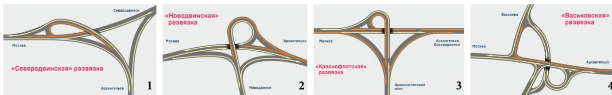
Рис. №4. Новые развязки на федеральной трассе М-8. 1. Северодвинская развязка; 2. Новодвинская развязка; 3. Краснофлотская развязка; 4. Васьковская развязка.

За 2016-2020 гг. населенные пункты получили новые генеральные планы. В плане Архангельска существенное место отводится взаимодействию муниципалитетов агломерации в разных направлениях. В купе с паспортом объединения «Большой Архангельск» предметно рассмотрены ряд насущных вопросов. Область пытается решить задачи строительной отрасли, социального развития, транспортной инфраструктуры, ЖКХ и аграрной промышленности.