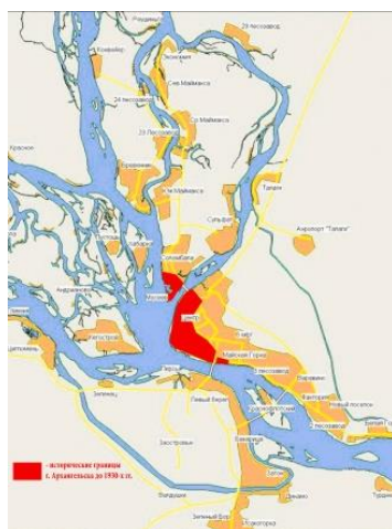
Рис. №2. План города после 1930-х гг. АОКМ.