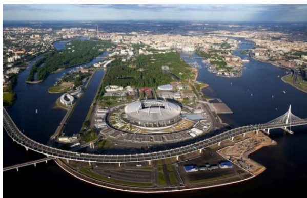
Рис. №3. Остров Крестовский в Санкт-Петербурге. Фото из открытых источников

Формирование рекреационно-досуговой и спортивной территории на примере отечественного и зарубежного опыта организации спортивно-парковых комплексов на островных территориях будет создаваться постепенно. К ярким примерам использования островов под зоны спорта и отдыха можно отнести о. Крестовский в Санкт-Петербурге, о. Отдыха в Красноярске, «Город науки и искусств» в русле реки Турия в Валенсии (Испания). (рис № 5,6,7)