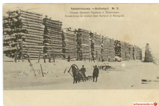
рис. 4. Склады бревен завода Суркова и Шергольда.

Архивные документы сохранили весьма скудные сведения о жизни на Сурковской кошке в дореволюционный период. Долгое время на острове располагался сплавной участок, а песчаные пляжи были любимым местом отдыха горожан. Жилых строений, кроме каморки сторожа на острове не было. В 1920 г. завод на 6-ой версте и Сурковская кошка были отнесены к пригороду Архангельска. Постановлением президиума ВЦИК «О расширении городской черты г. Архангельска» в 1927 г. территории лесозавода им. В.И. Ленина, лесобиржи на острове Сурковская кошка включены в состав «Большого Архангельска». Позднее с 1932 по 1990 гг. предприятие со всем участками было отнесено в состав Верхне-Двинского (в разные годы переименованного в Ежевский и Первомайский) района [4, Ф.р. - 621. Оп. 1. Д. 139. Л. 3об.-4; 4, Ф.р.- 621. Оп. 1. Д. 156. Л. 5; 4, Ф.р.-2063. Оп. 1. Д. 503а. Л. 54; 4, Ф.п. - 834. Оп. 1. Д. 416. Л. 5].