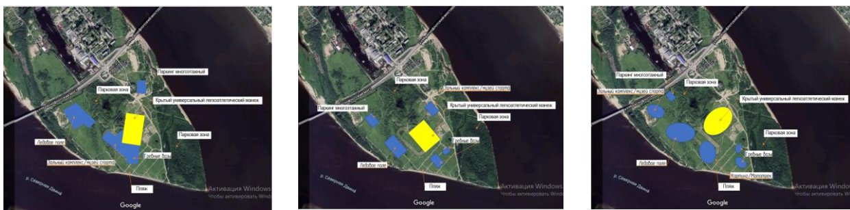
Рис №8-10. Примеры объемно-планировочных решений

Необходимость создания рекреационно-спортивных и досуговых пространств, а также относительная неразвитость данной инфраструктуры свойственна не только агломерации «Большой Архангельск», но и многим российским городам. Они нуждаются в развитии ландшафтно-рекреационных зон спортивной и досуговой направленности. Отечественный и зарубежный опыт доказывает их востребованность и определяет ряд функций, основными из которых можно назвать: восстановление здоровья граждан; создание территорий отдыха и культурного досуга населения; сохранение экологического равновесия в населенном пункте. На таких территориях необходим комплексный подход к решению проблемы – не только организация досуга, позволяющего гармонично совмещать спорт, культурные мероприятия, развлечения, но и создание интерактивной прогулочной зоны для различных возрастных и маломобильных групп населения. Формирование рекреационно-спортивной и досуговой территории должно базироваться на основных критериях: 1.среда спорта – 2.среда культурного досуга – 3.природные ландшафты – 4.инвестиционная привлекательность – 5.сервисное обслуживание – 6.инженерное и транспортное обеспечение.