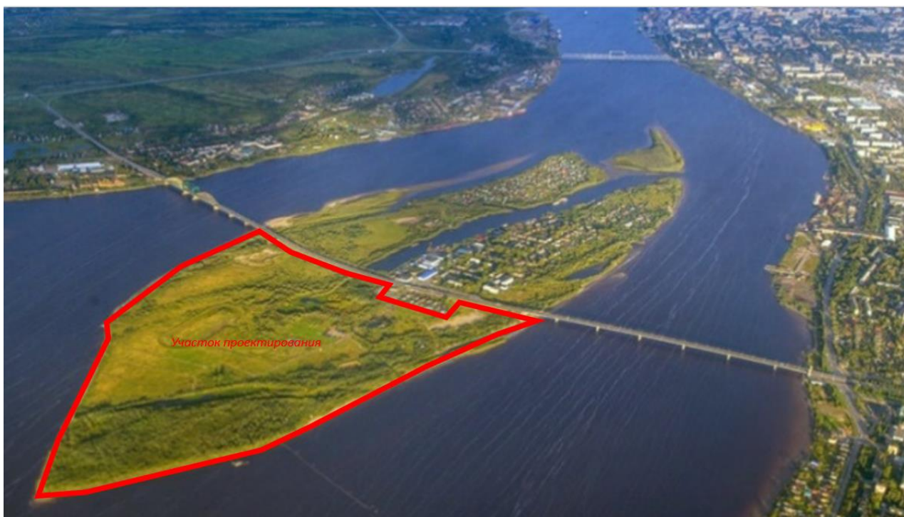
Рис № 5 Территория участка проектирования