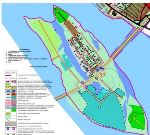
Рис № 6. Опорный план из проекта планировки округа «Майская горка». Ленгипрогор.