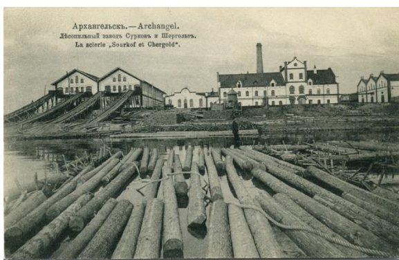
рис. 3. Лесопильный завод на 6 версте товарищества «Суркова и Шергольда». АОКМ.