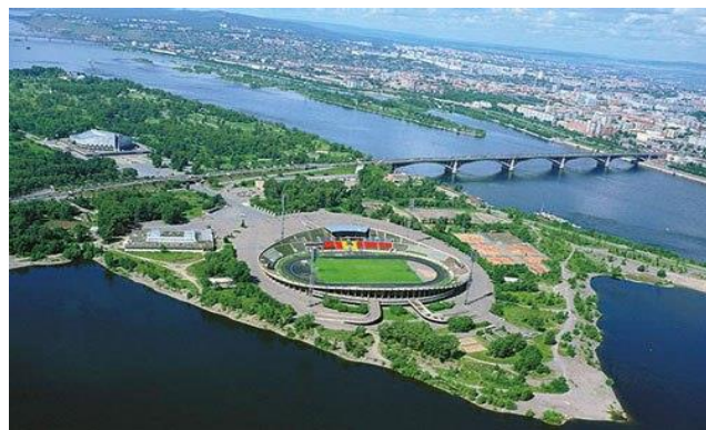
Рис. №4. Остров Отдыха в Красноярске.

3. Задание на проектирование рекреационно-досуговой зоны определяет состав необходимых помещений. В них входит в первую очередь: гостиница, интернат для воспитанников ДЮСШ, административно-офисный блок, помещения и выставочные залы МИСАО (Музей истории спорта Архангельской области), медико-реабилитационный центр, парковая зона (1,0-3,0га) с ландшафтным дизайном и инфраструктурой отдыха.