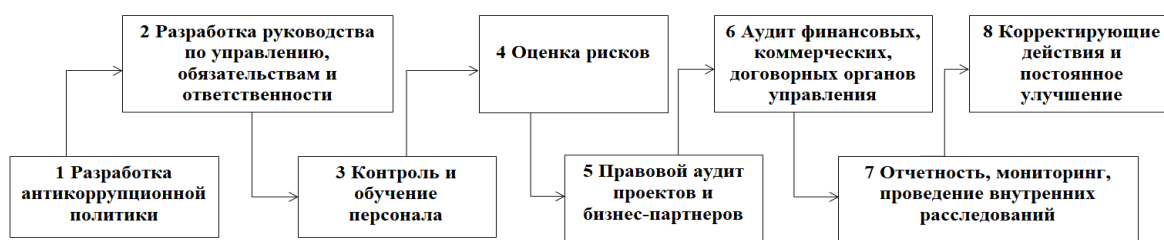
Рисунок 2 – Этапы внедрения стандарта ISO 37001:2016

Этапы внедрения стандарта ISO 37001:2016 практически не отличаются от стандартных этапов внедрения СМК согласно ISO 9001:2015 (рисунок 2). Стоит отметить, что внедрение системы менеджмента противодействия коррупции (СМПК), будет проходить гораздо легче, если на предприятии уже внедрена система менеджмента качества. Систему менеджмента по стандарту ISO 37001:2016 можно также сертифицировать, т.е. получить сертификат соответствия. Однако даже соответствие организации требованиям системы менеджмента ISO 37001:2016 не означает, что не существует или не может быть случаев коррупции, но это означает, что организация сделала разумно (пропорционально размеру и рискам организации) всё возможное для предотвращения случаев коррупции.