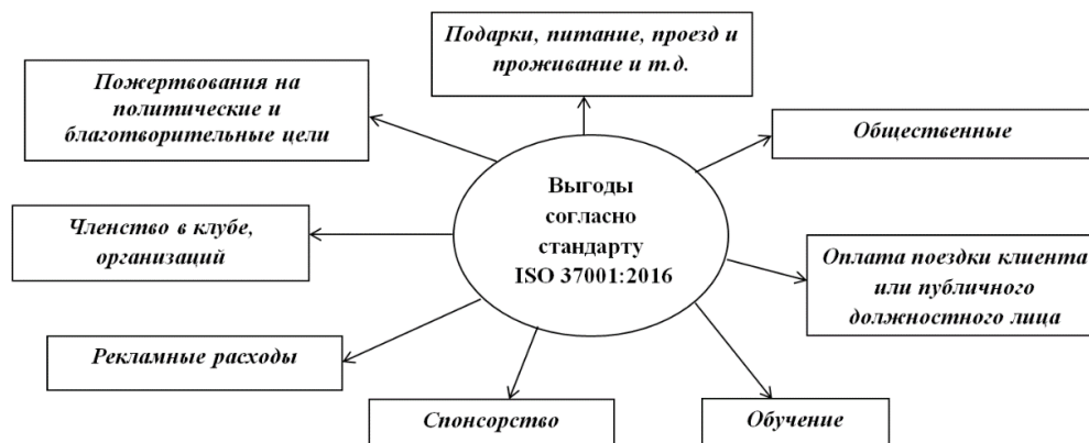
Рисунок 1 – Выгоды согласно стандарту ISO 37001:2016

считаются не только денежные вознаграждение или нематериальные блага, полученные в результате сговора. Взятками также считаются малейшие подарки или представительские расходы и пожертвования, рассматриваемые в стандарте как выгоды (рисунок 1).