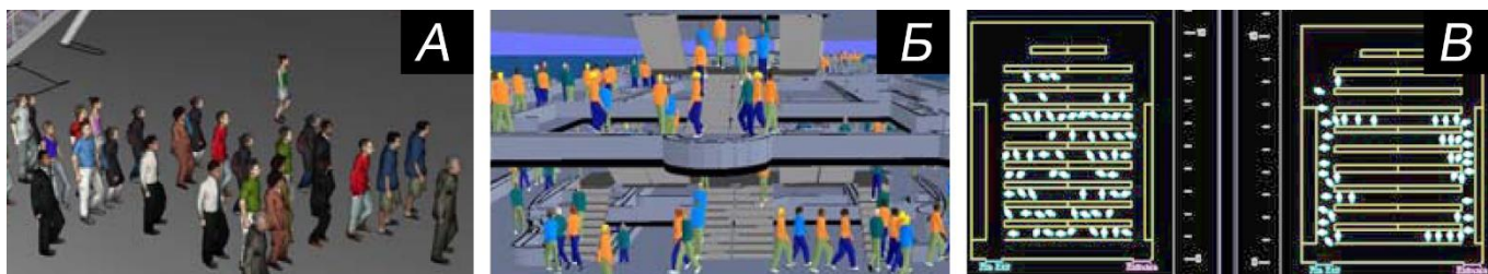
Рис. 1. Интерфейс программ движения школьников и учителей при эвакуации: А – Pathfinder; Б – Building Exodus; В – Simulex

Интерфейс рассмотренных программ движения школьников и учителей при эвакуации представлен на рис. 1.