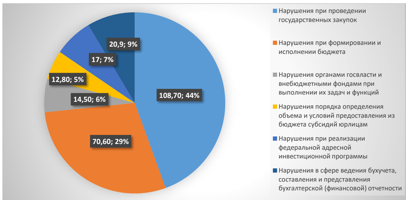
Рисунок 1. Объем нарушений, обнаруженных Счетной палатой за 2020 год (млрд. руб.) [5].

Эффективность финансового мониторинга с использованием финансовых технологий в сфере правового регулирования финансового контроля и надзора отражает факт повышение раскрываемости количества нарушений, обнаруженных Счетной палатой Российской Федерации по сравнению с предыдущим отчетным периодом (рисунок 1, рисунок 2). Данные диаграмм отражают эффективность внешнего контроля, проводимого Счетной палатой РФ в условиях использования передовых инструментов в области финтех.