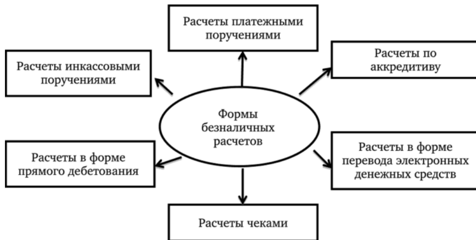
Рисунок 1 – Формы безналичных расчетов

Безналичные расчеты проходят посредством зачисления денежных средств на банковский счет получателя в различных формах, представленных на рисунке 1 [1].