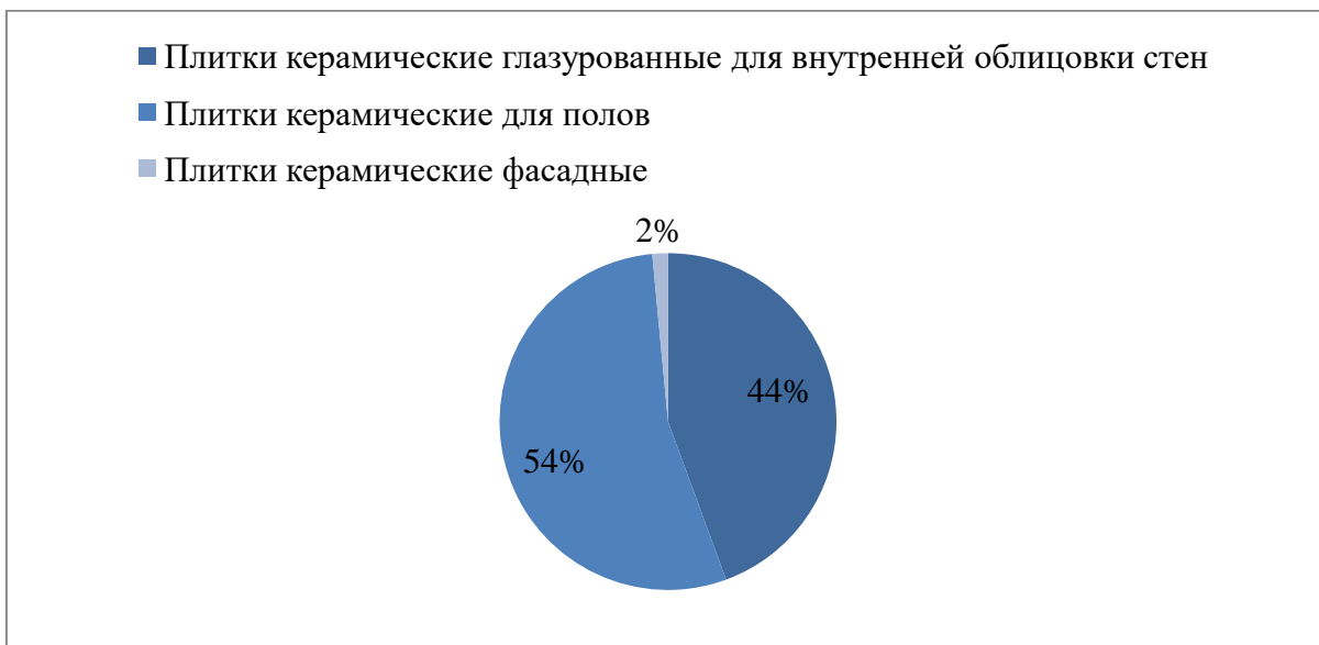
Рисунок 2 – Структура производства плитки по назначению в 2022 году %*